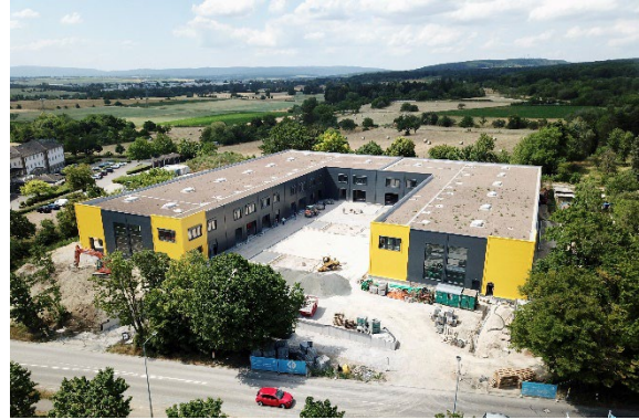
Drohnenaufnahme Juni 2022

Hofheim-Diedenbergen liegt zentral in der Rhein-Main-Region. Durch die Nähe zur Metropole Frankfurt, zu Wiesbaden und zu Mainz, sowie zum Rhein-Main-Flughafen ist die Gemeinde optimaler Standort für viele namhafte große Unternehmen aber auch für rund 3.000 klein- und mittelständische Handels-, Handwerks- und Dienstleistungsbetriebe, die seit Jahren zu einer ausgewogenen Wirtschaftsstruktur beitragen.