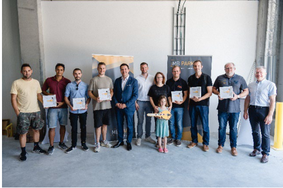
Gruppenfoto mit Mietern